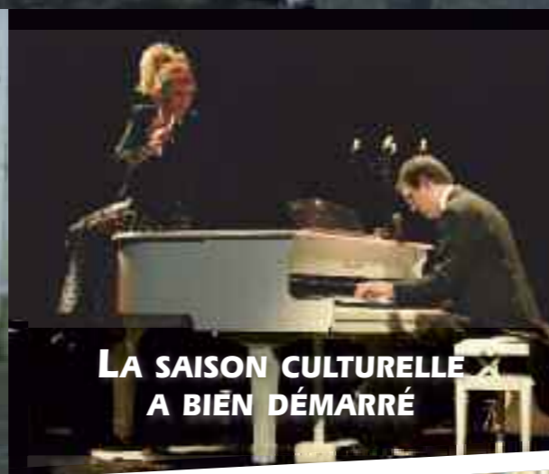
LA SAISON CULTURELLE A BIEN DÉMARRÉ