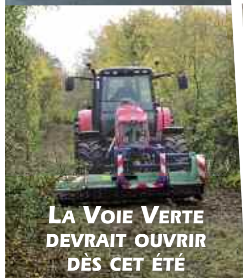
LA VOIE VERTE DEVRAIT OUVRIR DÈS CET ÉTÉ