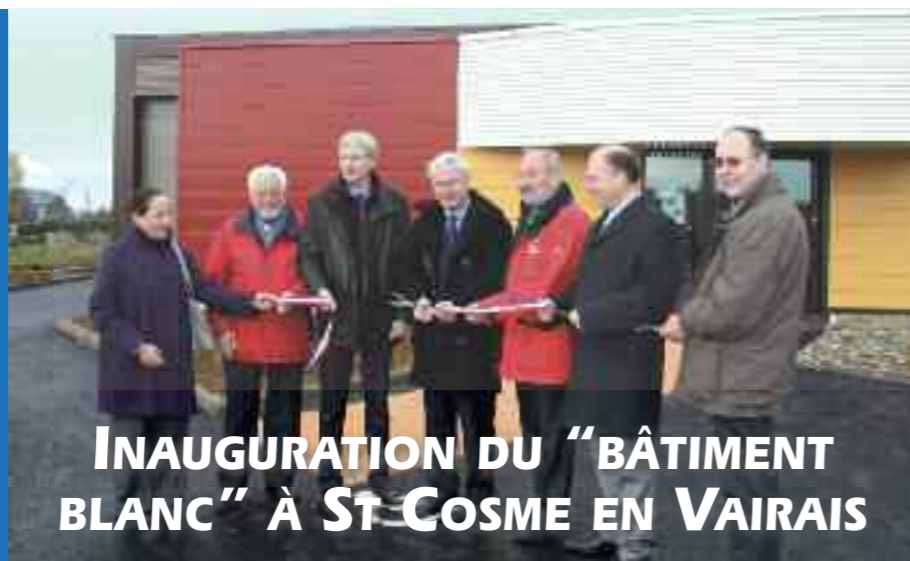
INAUGURATION DU "BÂTIMENT BLANC" À ST-COSME EN VAIRAIS