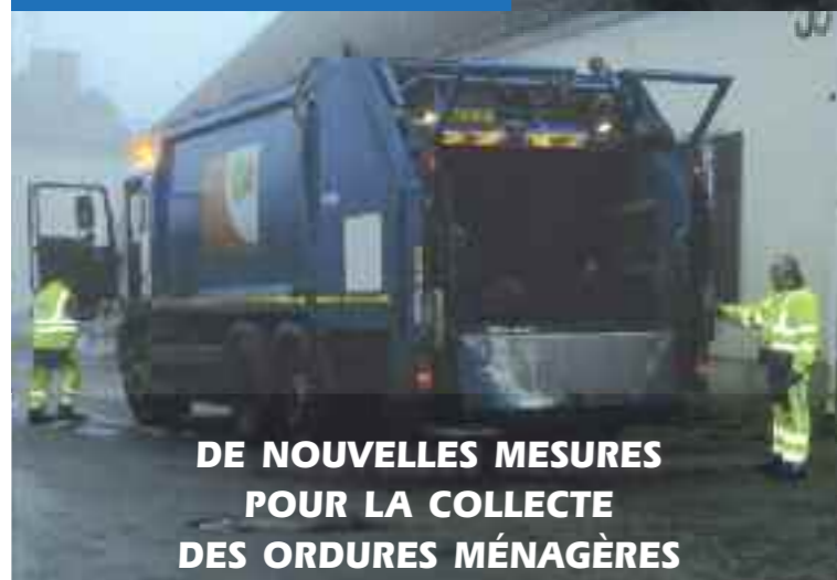
DE NOUVELLES MESURES POUR LA COLLECTE DES ORDURES MÉNAGÈRES