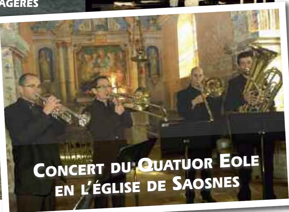
CONCERT DU QUATUOR EOLE EN L'ÉGLISE DE SAOSNES